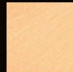
Tamponato superficie liscia Effetto tamponato on smooth wall