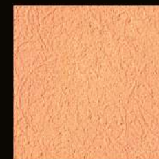
Tamponato su intonachino Effetto tamponato on intonachino